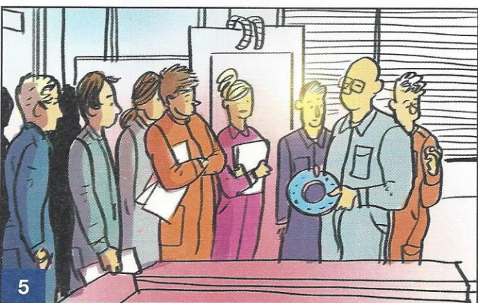
5 Bovendien kan hij gemotiveerde leerlingen enthousiasmeren voor een stage en/of een leerwerkplek bij Van Wamel. En met zijn pedagogisch didactisch diploma op zak heeft hij meer mogelijkheden om tot aan zijn pensioen leuk werk te blijven doen.